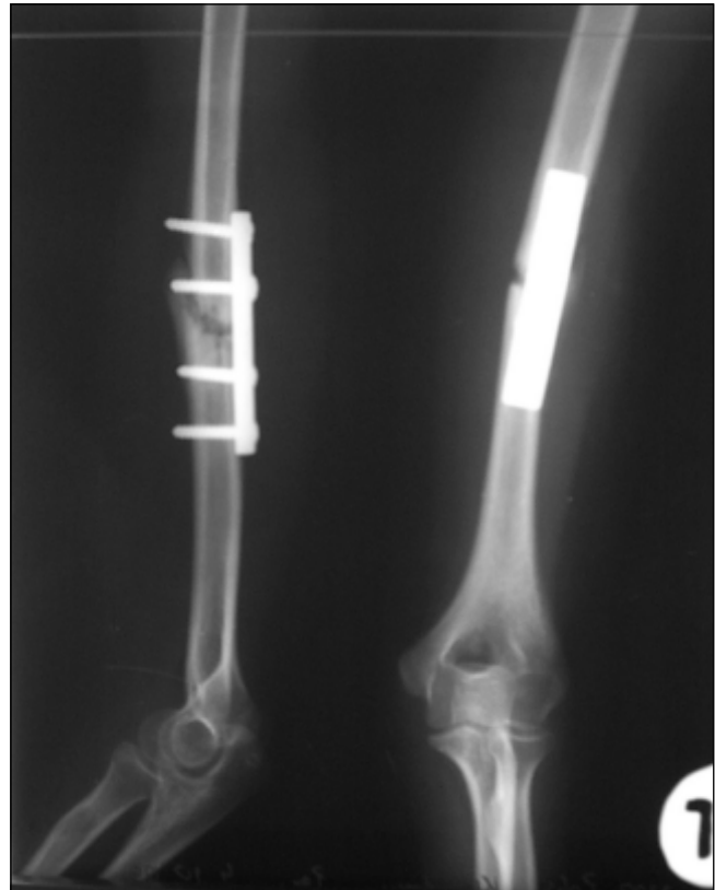
Ryc. 1. Rtg kości ramiennej lewej 19.07.2006 X-ray of the left humeral bone 19.07.2006

dzono rękę opadającą, brak czynnego wyprostów w stawie promieniowo-nadgarstkowym, w stawach śródrečno-paliczkowych i międzypaliczkowych bliższych i dalszych z przymusowym zgięciem palca IV i V. Jednocześnie brak było ruchu odwodzenia palców od II do V i kciuka. Występowały zaburzenia czucia w części grzbietowej ręki lewej z przewagą w okolicy kciuka oraz palca V i zewnętrznej części palca IV. W badaniu radiologicznym (19.07.2006): zespolenie wewnętrzne złamania kości ramiennej lewej z widoczną szczeliną złamania.