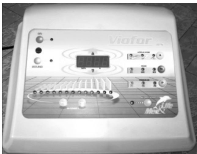
Ryc. 2. Aparat do magnetostymulacji VIOFOR JPS Viofor JPS apparatus for magnetic stimulation

Niedowładną kończynę zabezpieczono szyną w funkcjonalnie poprawnym, ustawieniu stosując na całą kończynę ocieplacz. Dziewczynka została przyjęta do leczenia w Klinice Chorób Wewnętrznych, Angiologii i Medycyny Fizykalnej w Bytomiu. Została poddana terapii polem magnetycznym o właściwościach magnetostymulacji aparatem VIOFOR JPS. Częstotliwość impulsów podstawowych zastosowano w przedziale 180–195 Hz, częstotliwości paczek impulsów w przedziale 12,5–29 Hz, grupy paczek 2,8–7,6 Hz, a serie zaś po 0,08–0,3Hz. Kształt podstawowych impulsów był zbliżony do piłokształtnego.