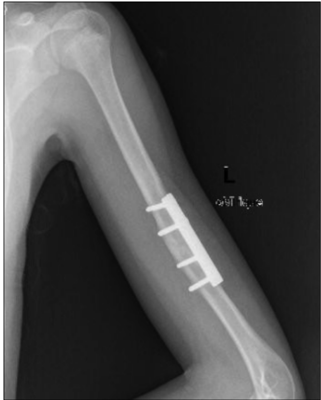
Ryc. 4. Rtg kości ramiennej lewej 21.02.2007 X-ray of the left humeral bone 21.02.2007

Dobry efekt leczenia zachowawczego u 14-letniej chorej pozwala na wniosek, że wczesne zastosowanie magnetostymulacji z jonowym rezonansem cyklotronowym wpłynęło korzystnie na regenerację nerwów obwodowych i zaburzenia zrostu kostnego (wyniki potwierdzone w EMG i RTG przed i po terapii) oraz pozwoliło uniknąć wcześniejszej rewizji operacyjnej.